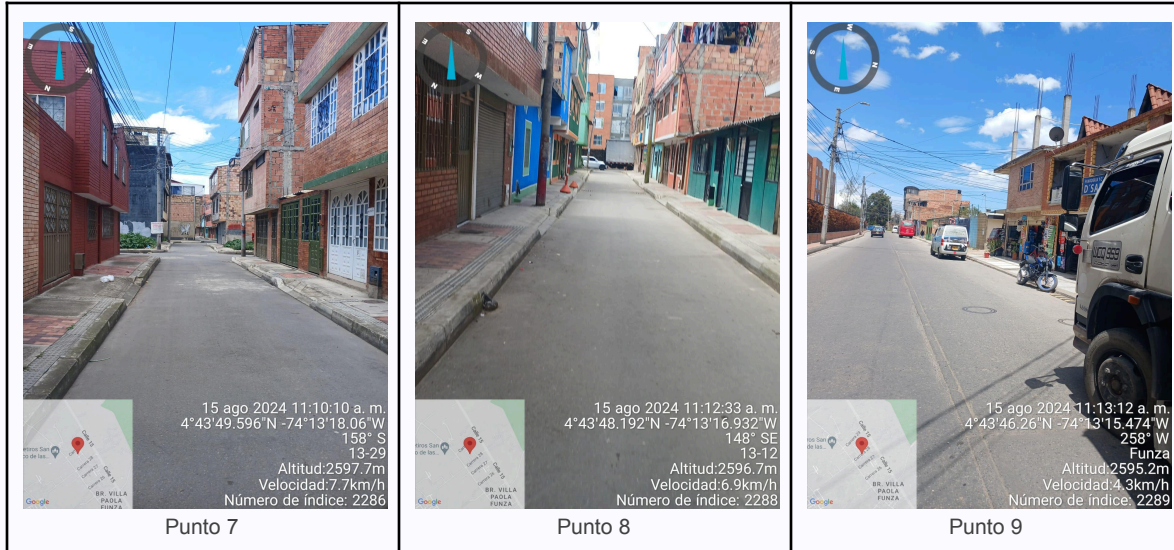
Ilustración 2. Fotos de los puntos del Recorrido de Control Y Vigilancia.